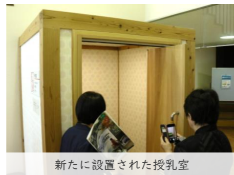
新たに設置された授乳室