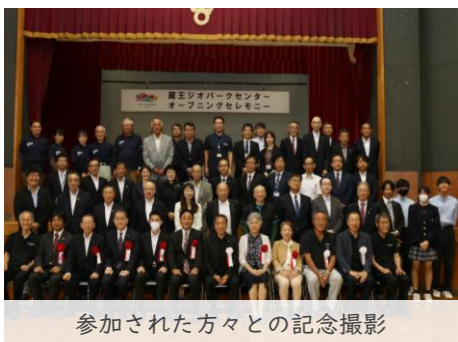
参加された方々との記念撮影