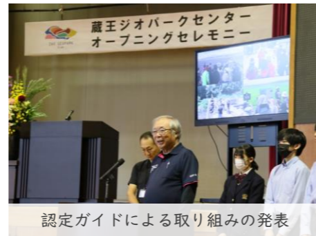
認定ガイドによる取り組みの発表