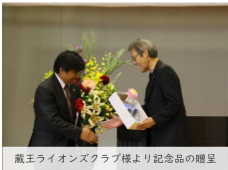
蔵王ライオンズクラブ様より記念品の贈呈