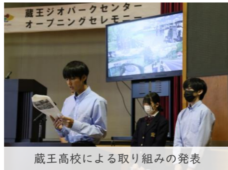
蔵王高校による取り組みの発表