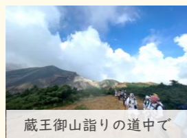
蔵王御山詣りの道中