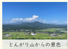
とんがり山からの景色