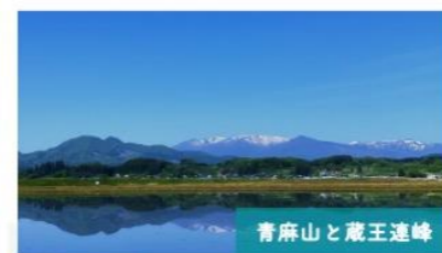
青麻山と蔵王連峰