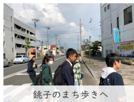
銚子のまち歩きへ