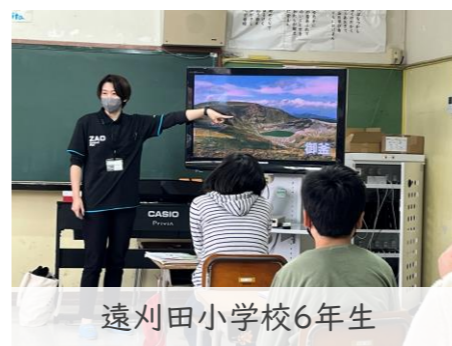
遠刈田小学校6年生

秋～初冬にかけては、出前講座や現地見学の最盛期です。町内の各学校で「流れる水のはたらき」に関する現地見学や、理科の単元の内容に基づいた出前講座が実施されています。観察や体験を織り交ぜて行う出前講座は、一般の方にも好評です。興味のある方はお問い合わせください！