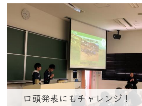
口頭発表にもチャレンジ！