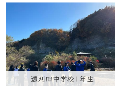
遠刈田中学校1年生