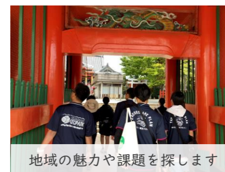
地域の魅力や課題を探します