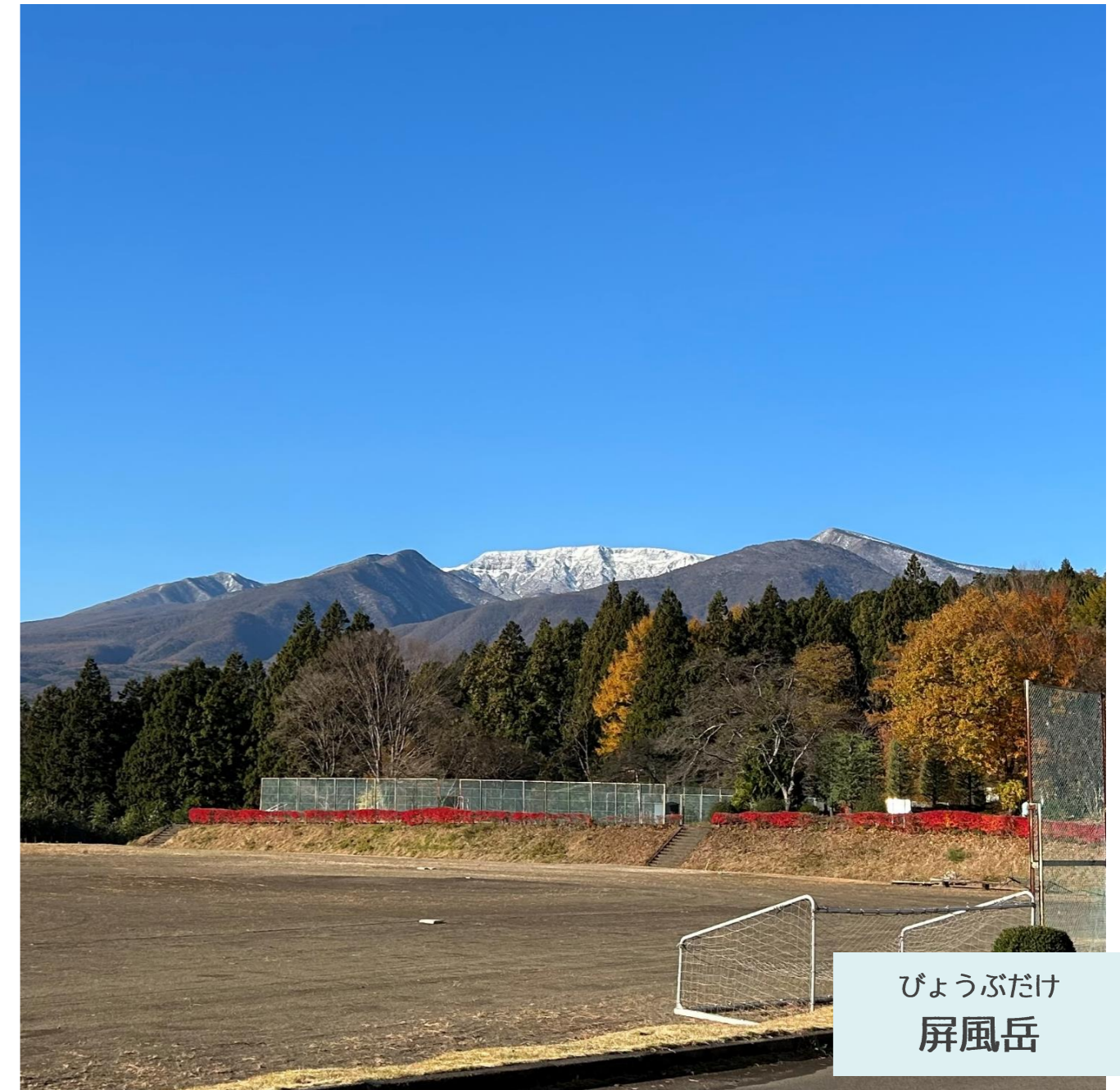
びょうぶだけ 屏風岳