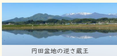
円田盆地の逆さ蔵王