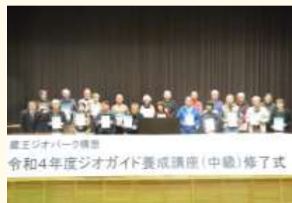
蔵王ジオパーク推進協議会 令和4年度ジオガイド養成講座(中級)修了式

蔵王ジオパーク推進協議会では、昨年11月、所定の講座を修了した23名を「認定ガイド」として認定しました。現在は、学校や団体の現地学習でのガイドを務めるだけでなく、ジオツアーの企画や研修などを行っています。